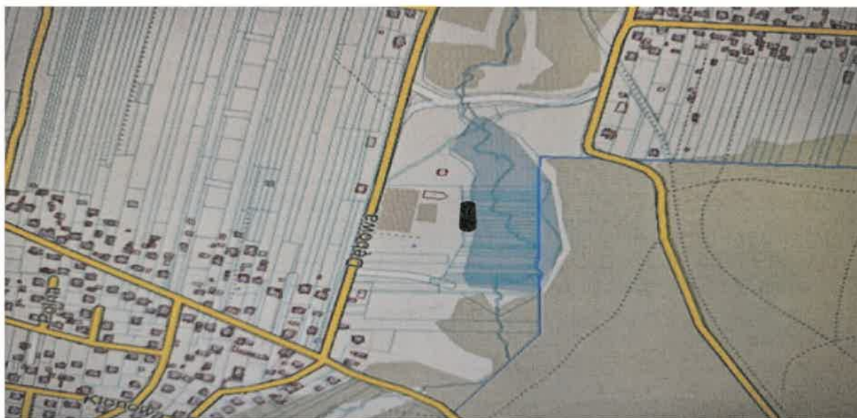
Zdjęcie 7 Położenie zbiornika