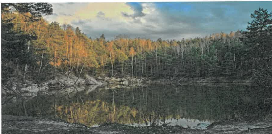
Zdjęcie 10 Rezerwat Barcza