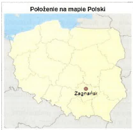
Zdjęcie 1 Położenie na mapie Polski

Gmina Zagnańsk, położona jest w północnej części województwa świętokrzyskiego, na terenie powiatu kieleckiego. Obejmuje 36 miejscowości podzielona jest na 17 sołectw: (Bartków, Belno, Chrusty, Długojów, Gruszka, Janaszów, Jaworze, Kajetanów, Kaniów, Kołomań, Lekomin, Samsonów, Szałas, Tumlin, Umer, Zachełmie, Zagnańsk). Gmina zajmuje powierzchnię 12 487 ha, rozciąga się na długości około 13,5 km w kierunku północ – południe i ponad 15 km w kierunku wschód – zachód.