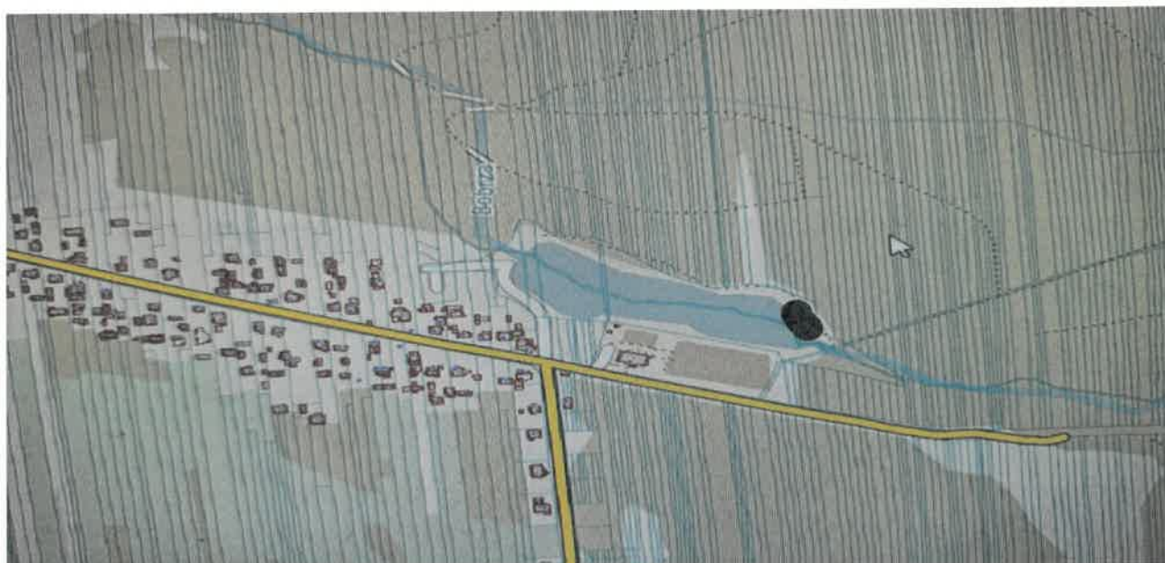
Zdjęcie 9 Położenie zbiornika