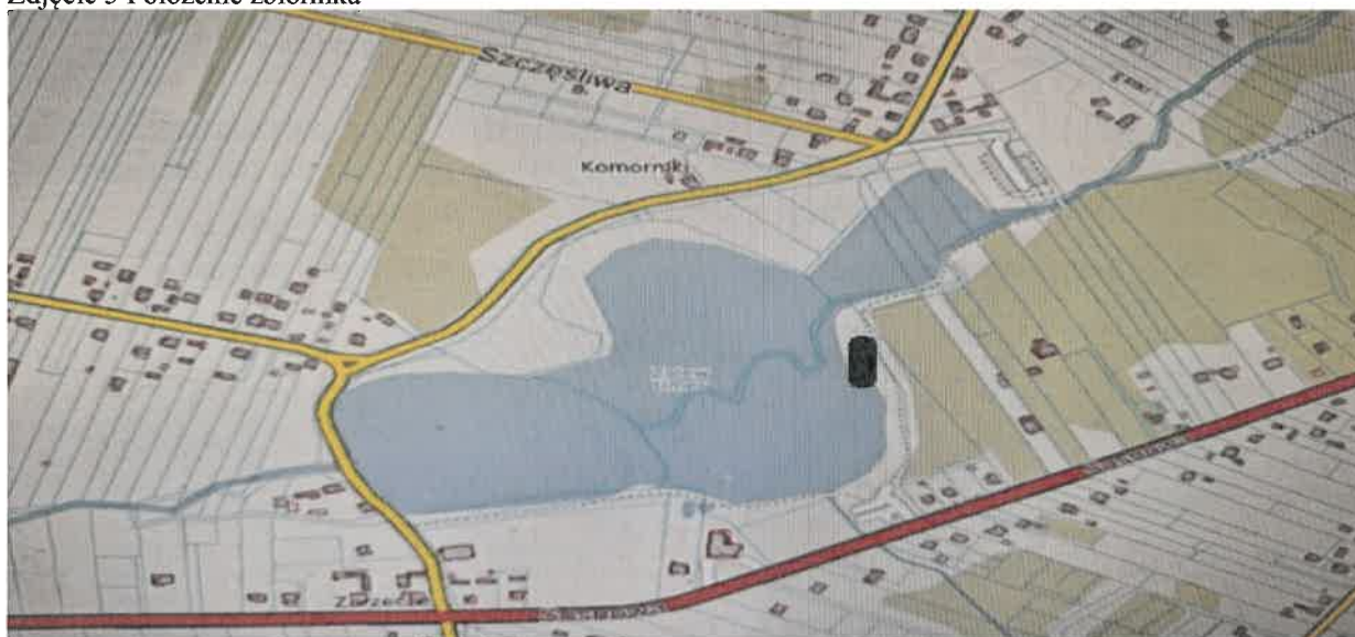
Zdjęcie 5 Położenie zbiornika

Zbiornik Umer położony jest w miejscowości Umer. Jest zbiornikiem przepływowym (zbiornik małej retencji). Zlokalizowany jest na rzece Bobrzy. Podstawowym jego zadaniem jest piętrzenie i retencjonowanie wód powierzchniowych, ochrona przeciwpowodziowa, także ochrona przeciwpożarowa, wyrównywanie poziomu zwierciadła, a także łagodzenie skutków suszy. Zbiornik stanowi zaplecze wypoczynkowe i mobilizuje do aktywności fizycznej. Zarówno mieszkańcy jak i turyści mogą cieszyć się bogactwem natury dzięki wydzielonym strefom dla turystów. Do ich dyspozycji są altany biesiadne, miejsca na ognisko, boisko do siatkówki oraz miejsca parkingowe. W sezonie letnim wyznacza się miejsca okazjonalnie wykorzystywane do kąpieli, gdzie o bezpieczeństwo korzystających z wody w wyznaczonych godzinach dbają ratownicy. W okresie letnim, woda poddawana jest badaniom jakości wody. Zbiornik wodny również wykorzystywany jest do połowu ryb.