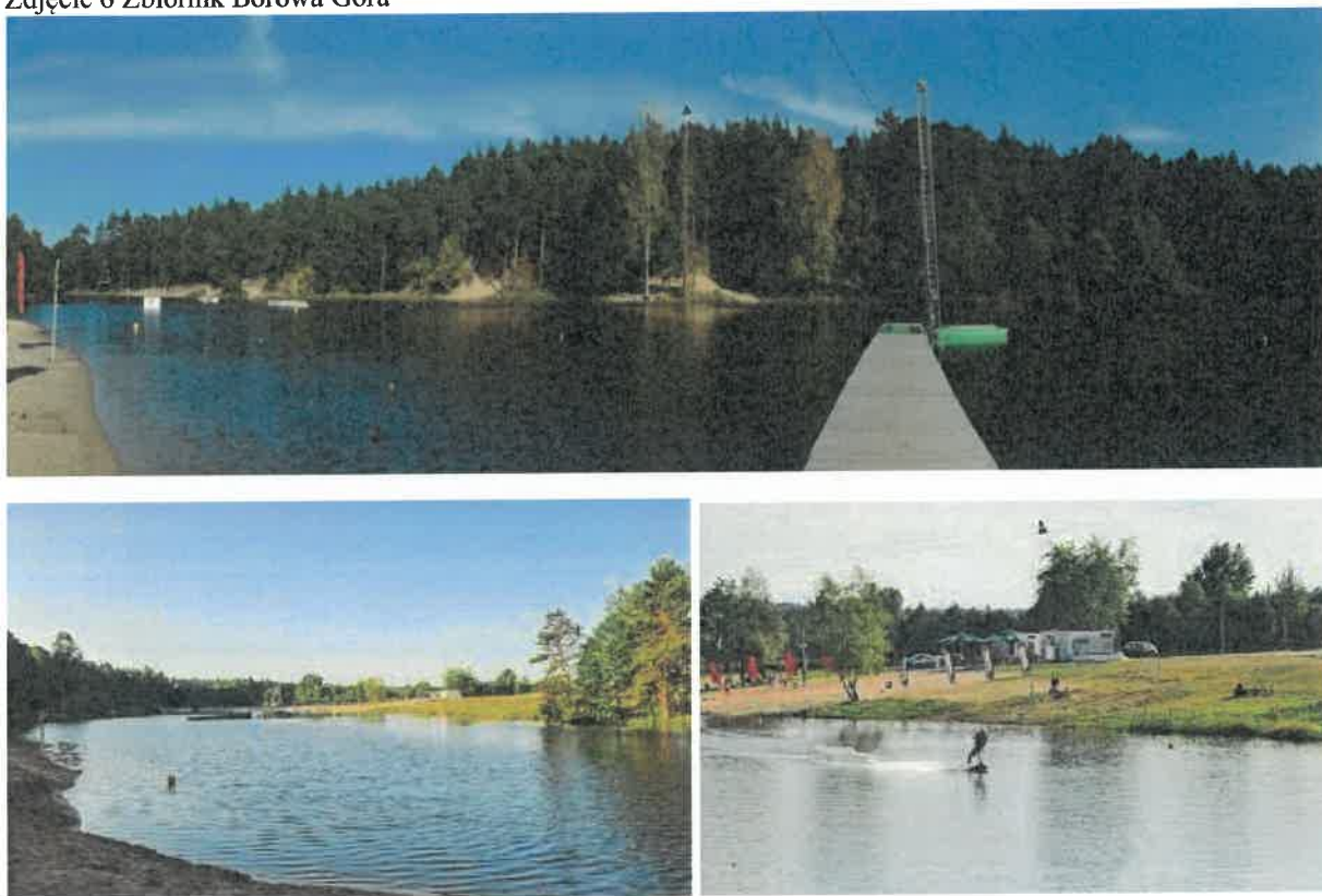
Zdjęcie 6 Zbiornik Borowa Góra