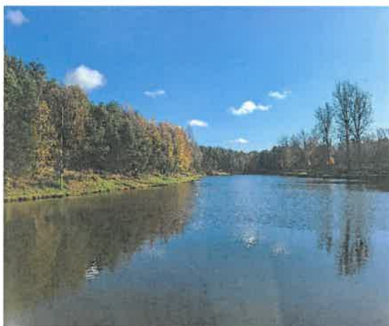
Zdjęcie 8 Zbiornik Zachełmie