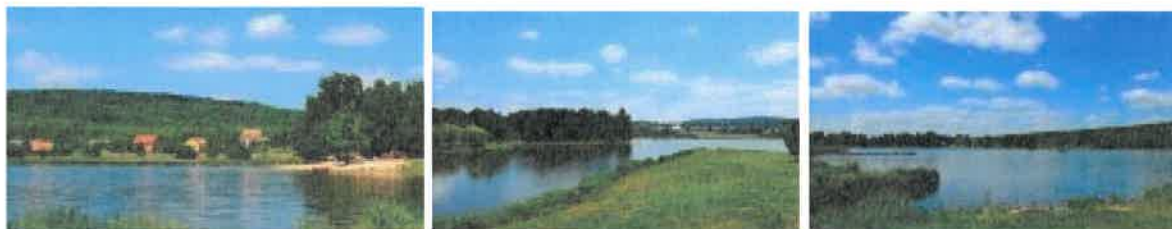
Zdjęcie 4 Zbiornik Umer