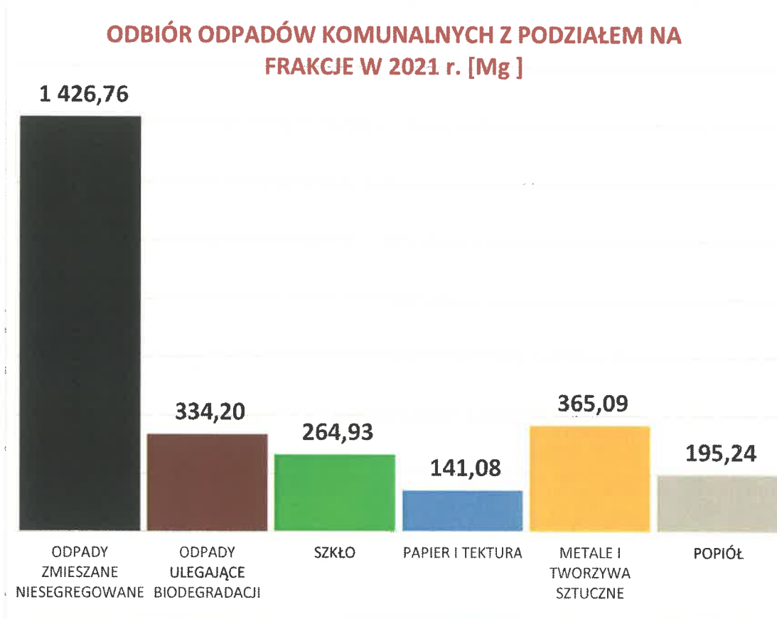
Rys.3 Odbiór odpadów komunalnych z podziałem na frakcje w 2021 r.

W systemie obwoźnych zbiórek od mieszkańców Gminy Zagnańsk odbierane były następujące frakcje: