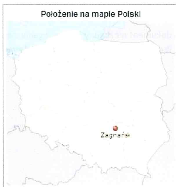
Rysunek 1. Położenie gminy nas tle Polski

Jako obszar endogeniczny należy traktować obszar całej gminy Zagnańsk.