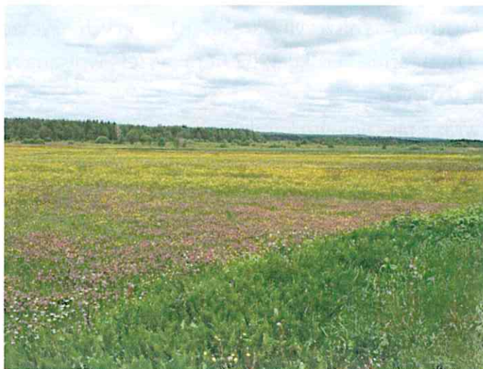
Rysunek 5. Dolina Krasnej.

trzęślicowych, muraw bliźniczkowych oraz torfowisk przejściowych należą do najlepiej zachowanych w regionie. Charakteryzuje się one dobrym i typowym wykształceniem. Stwierdzone w granicach obszaru niewielkie płyty torfowisk zasadowych są jedynymi z nielicznych w regionie.