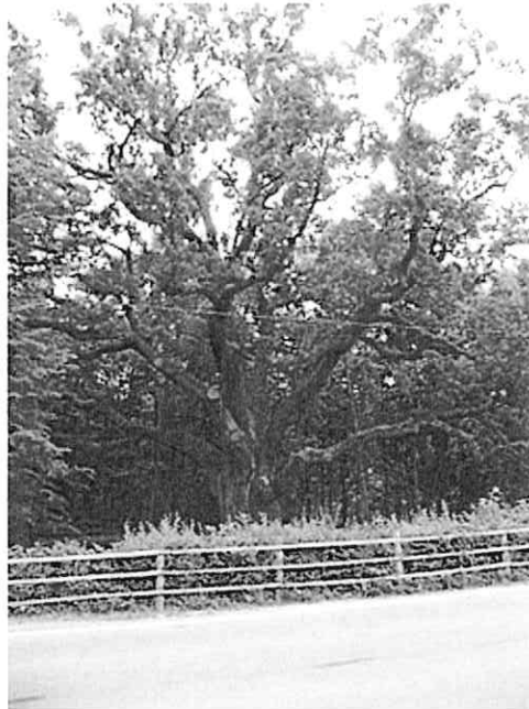
Rysunek 4. Dąb Bartek