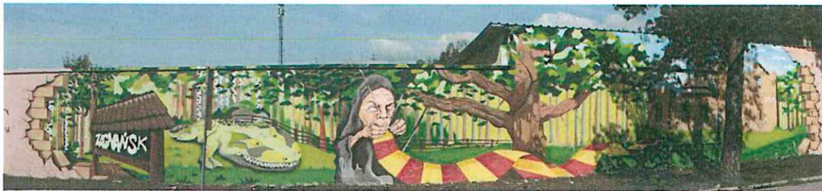
Rysunek 6. Mural