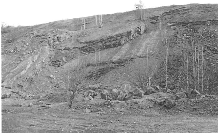
Rysunek 3. Kamieniołom w Zachełmiu