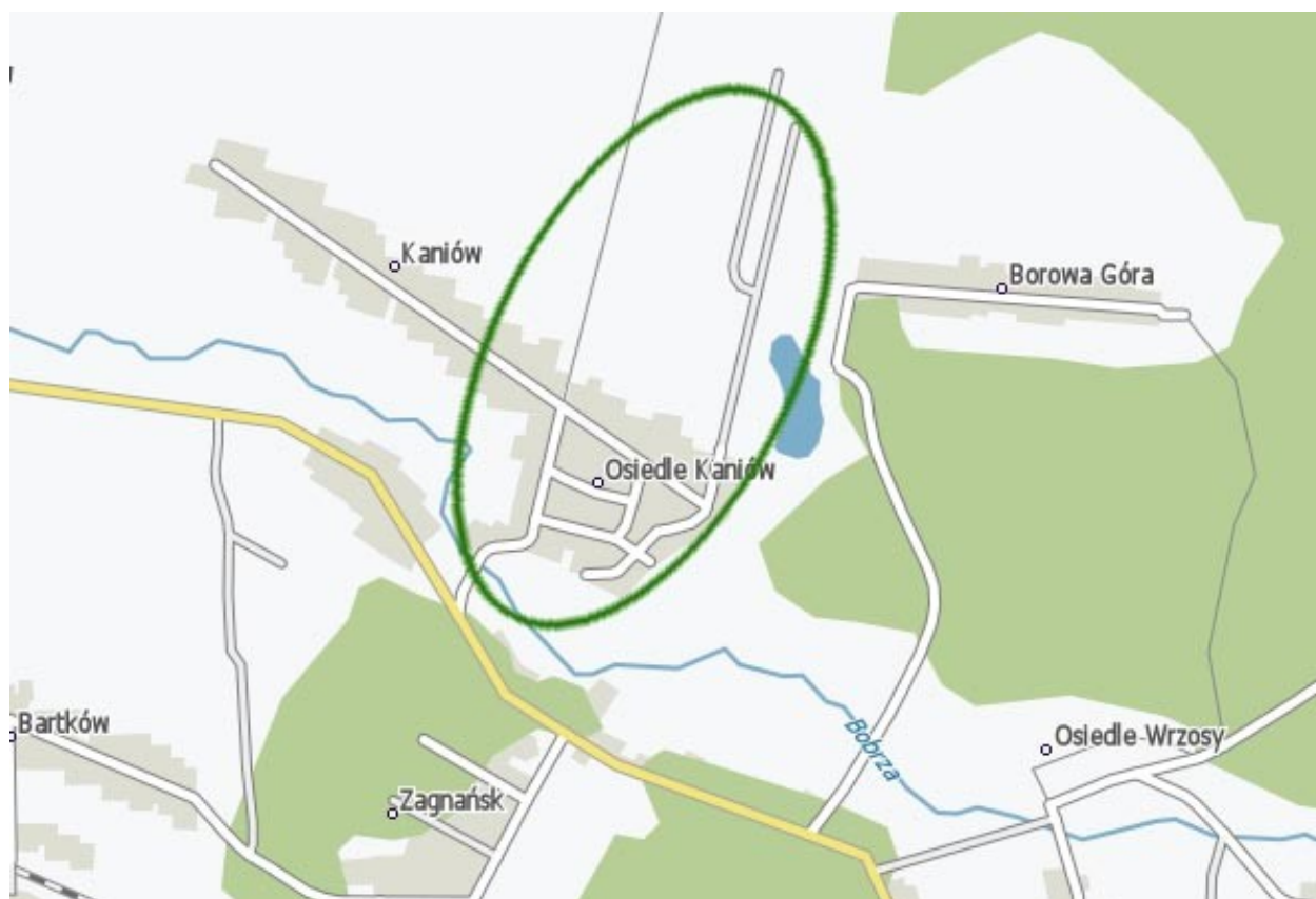
Mapa: Obszar o szczególnym znaczeniu dla zaspokojenia potrzeb mieszkańców sołectwa Kaniów

W tak określonej strefie realizowane będą zadania inwestycyjne związane z poprawą estetyki przestrzeni centrum miejscowości, a zarazem kształtowania przestrzeni aktywnego wypoczynku np. poprzez budowę sceny. Pozwoli to na kontynuowanie działań propagujących aktywne postawy i zdrowy tryb życia oraz dotarcie z nimi do coraz większej liczby odbiorców, a w rezultacie będzie miało wpływ na zaspokajanie potrzeb mieszkańców.