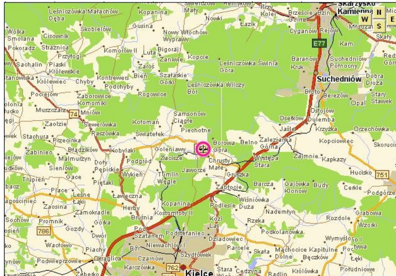
Mapa: Mapa drogowa okolic miejscowości z zaznaczeniem wsi Kaniów;