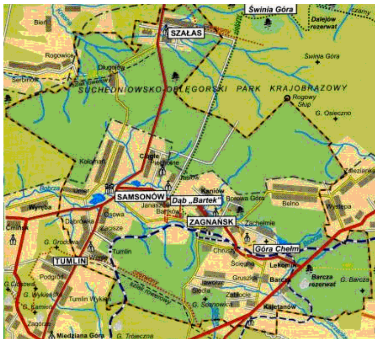
Mapa: Mapa administracyjna Gminy Zagnańsk;

Miejscowość Kaniów sąsiaduje z następującymi sołectwami: Janaszów, Zagnańsk, Belno, Zachełmie i Samsonów.